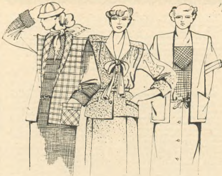
Модели художников Ленинградского Дома моделей одежды. Рисунки И. КРУТИКОВОЙ.

Мы видим молодых манекенщиц в платьях в крупную клетку, объемных блузонах. Не будем подражать им. Выберем клетку поменьше и сделаем платье с рукавом реглан, воротник — стойка, узкий пояс, карман. Шелковый шарф чуть более интенсивного тона осветит и украсит платье.