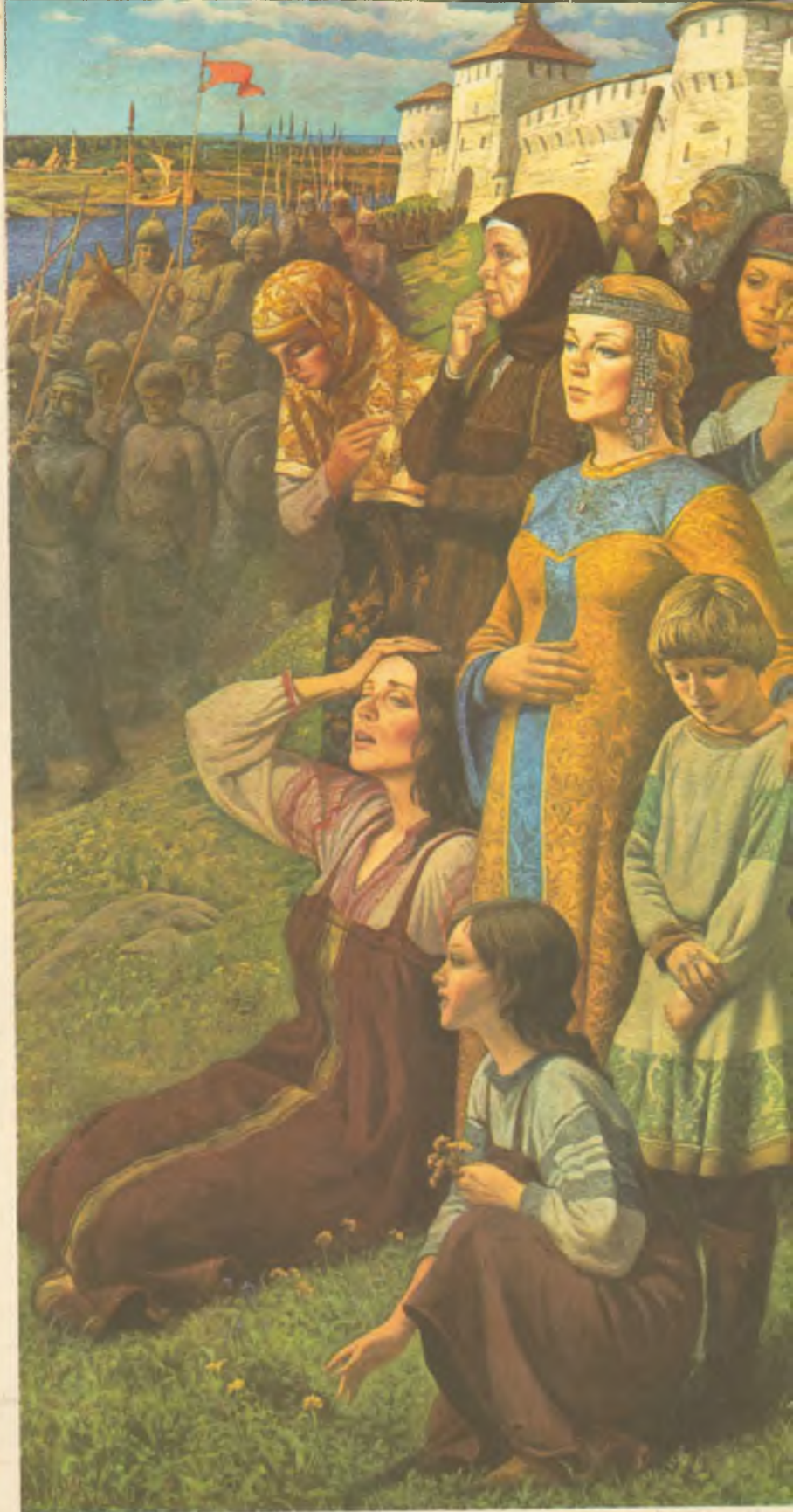
ПОЛЕ КУЛИКОВО. ЕВДОКИЯ.