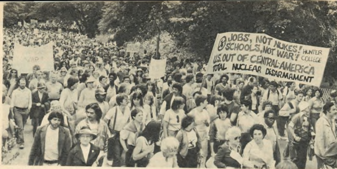
Участники Марша за ядерное разоружение в центральном парке Нью-Йорка. На плакатах написано: «Работа, а не ядерное оружие». «Школы, а не война». «Полное ядерное разоружение»