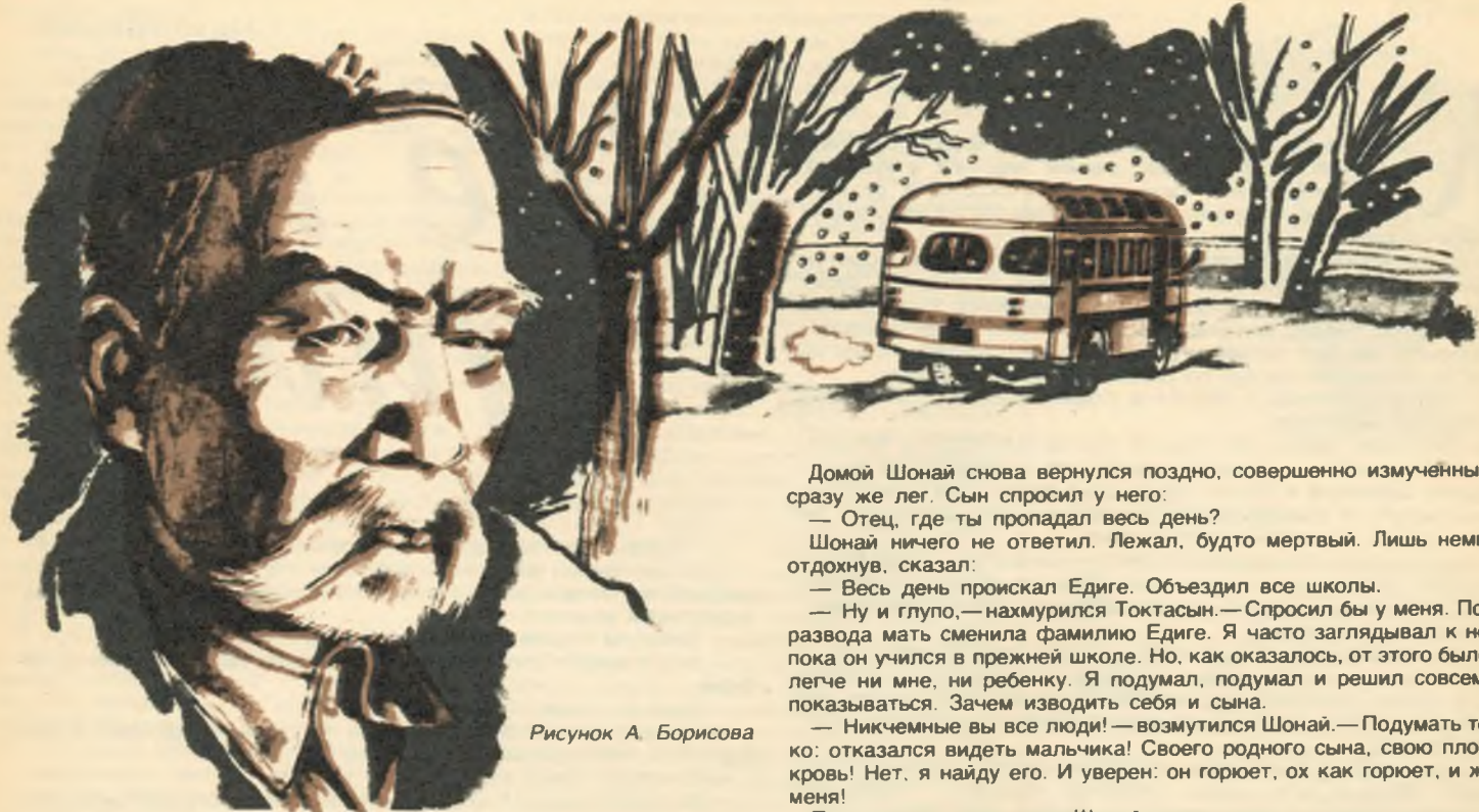
Рисунок А. Борисова

Во дворе было полно смуглолицых ребятшек. Некоторые, пробегая мимо Шоная, успевали сказать: