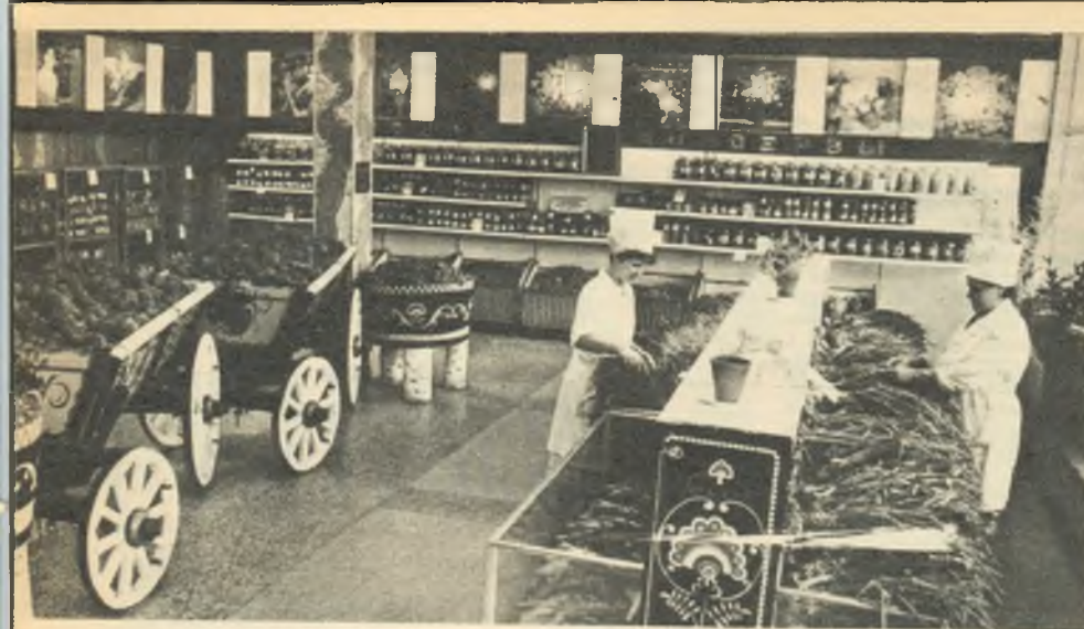
Вот так каждая утро готовится к встрече покупателей продавцы фирменного магазина «Яблонька» г. Омска.

чуть больше десятка видов огородной продукции, то сегодня — более тридцати. Причем 29 видов овощей выращивают здесь, на юге Сибири, на землях, которые никак не назовешь щедрыми.