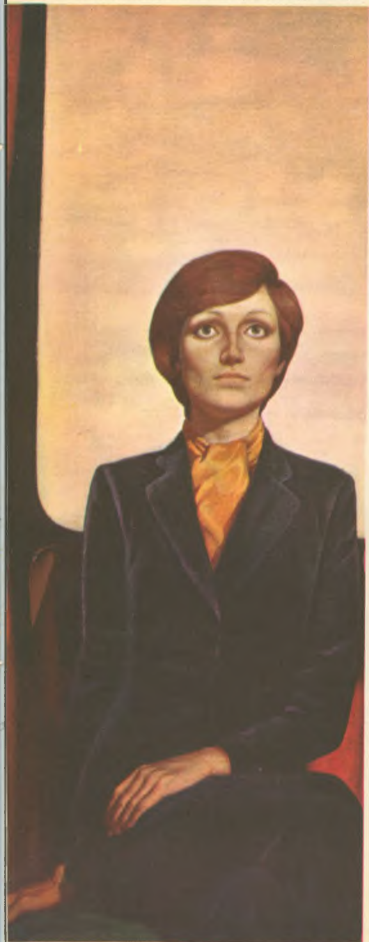
КИНО (центральная часть триптиха, фрагмент).