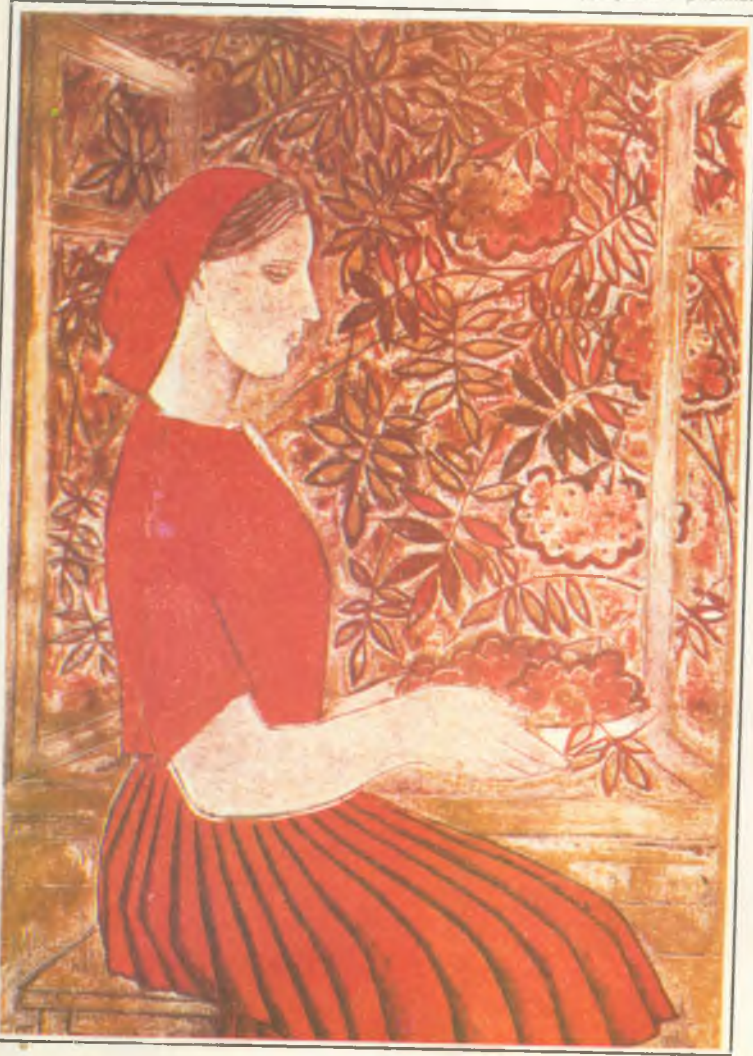
Девушка с рябиной

менты (жалейка, гусли) — все то, в чем, по моему мнению, воплотилось истинное влечение народа к прекрасному.