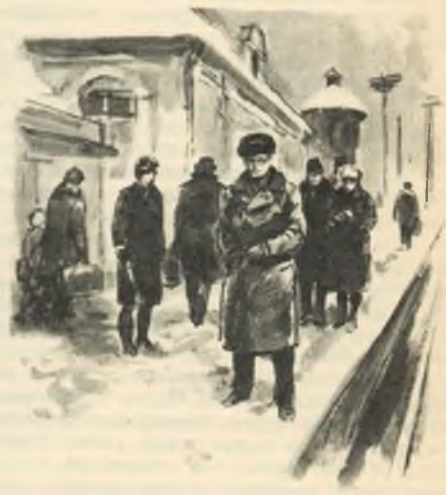
Рисунки В. Высоцкого.